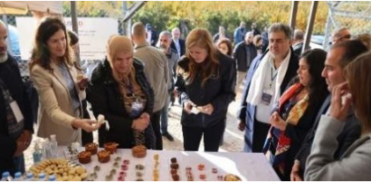
تندوّق مديرة الوكالة الأميركية للتنمية الدولية باور مع سفيرة الولايات المتحدة في لبنان شيا بعض الأطعمة التي أنتجتها تعاونية مجدل عنجر

يبلغ عدد سكان مجدل عنجر حوالي 25,500 لبناني و 32,000 نازح . أدى كثرة وجود النازحين في مجدل عنجر إلى إضعاف قدرة البلدية على تلبية الحاجات الأساسية من المياه بسبب أزمة الكهرباء والمحروقات المستمرة. كما حدّت الأزمة الاقتصادية المتفاقمة من قدرة التعاونية الزراعية على تحديث معدّاتها القديمة وغير الفعّالة، ممّا أثر على إنتاج المزارعين وساهم في تخفيض سبل عيشهم. استجابةً لهذا الوضع، قامت الوكالة الأميركية للتنمية الدولية، عبر برنامج دعم المجتمع المحلي، بتركيب وحدات طاقة شمسية، لتشغيل نظام ضخ المياه في البلدة، بالإضافة إلى إعادة تأهيل محطة الضخ الخاصة بها، وتحديث الغرفة المعالجة للكور مما يتيح الى حلّ الطاقة المتجدّدة وضمان الوصول المستمرّ للمياه لحوالي 19,000 مستفيد مع تخفيض التكاليف على السّكان والبلدية. في موازاة ذلك، زوّد برنامج دعم المجتمع المحلي التعاونية بمعدّات لتوسيع الإنتاج الزراعي، بما في ذلك المواقد والأفران والثلاجات، بالإضافة إلى آلات التّعبئة ومجفّفات الفواكه والخضروات لضمان سلامة الغذاء. وقد أدى هذا التّدخل إلى زيادة فرص الدّخل لما يقدر بنحو 100 أسرة زراعية تعاني من نقص الخدمات.