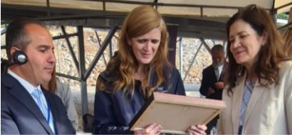
تلتقى مديرة الوكالة الأميركية للتنمية الدولية باور لوحة شكر من رئيس بلدية مجدل عنجر

خلال زيارتها إلى لبنان التي استمرت ثلاثة أيام، زارت مديرة الوكالة الأميركية للتنمية الدولية سامانثا باور مجدل عنجر في 9 تشرين الثاني 2022 ترافقها سفيرة الولايات المتحدة في لبنان، دوروثي شيا، مديرة بعثة الوكالة الأميركية للتنمية الدولية في لبنان وماري إيلين ديفيت، حيث قامت بجولة على محطة ضخ المياه في البلدة التي يتم تشغيلها حاليًا من خلال مزارع الطاقة الشمسية المقدمة من برنامج دعم المجتمع المحلي الممول من الوكالة الأميركية للتنمية الدولية. التقى الوفد برئيس بلدية مجدل عنجر، السيد سعيد ياسين و بعض أعضاء التعاونية من النساء اللواتي تحسّن وضعهن المعيشي بعد أن وفّر برنامج دعم المجتمع المحلي المعدات لتوسيع إنتاج التعاونية.