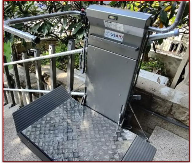
ركب برنامج دعم المجتمع المحلي التابع للوكالة الأميركية للتنمية الدولية جهاز الطاقة اللامنتقطة UPS لتزويد كلية التمريض في مركز الصليب الأحمر اللبناني في بعثا بالكهرباء ومصعد للكرسي المتحرك لتعزيز إمكانية الوصول

" حسنت المعدات التي قدمها برنامج دعم المجتمع المحلي التابع للوكالة الأميركية للتنمية الدولية، العملية التعليمية في الكلية، لا سيما من حيث توفير الموارد الكافية للسماح للطلاب بممارسة ما تعلموه في بيئة تعليمية مستقرة"،