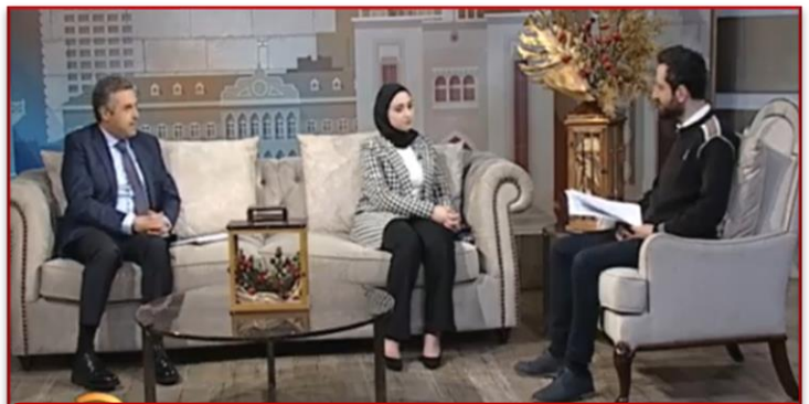
تلفزيون لبنان - احلى صباح 30 آذار 2023

تم تحضير هذه النشرة الإخبارية بفضل دعم الشعب الأميركي من خلال الوكالة الأميركية للتنمية الدولية (USAID) ضمن برنامج دعم المجتمع المحلي (CSP) في لبنان. إن محتوى هذه النشرة الإخبارية لا يعكس بالضرورة وجهة نظر الوكالة الأميركية للتنمية الدولية أو حكومة الولايات المتحدة.