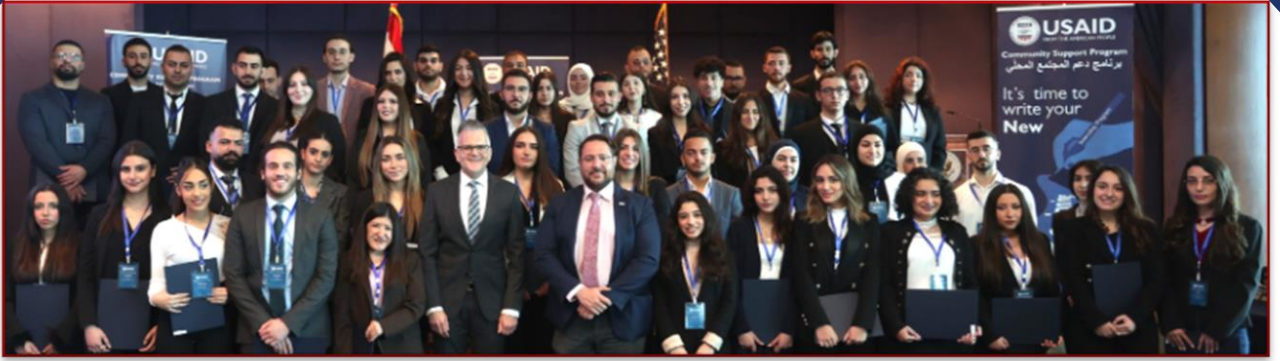
صورة جماعية للمتدربين مع ممثلي السفارة الأميركية والوكالة الأميركية للتنمية الدولية خلال حفل انتهاء التدريب الوظيفي

في 23 آذار/مارس 2023، كأفأ برنامج دعم المجتمع المحلي التابع للوكالة الأميركية للتنمية الدولية (USAID) جهود 76 طالبًا جامعيًا تخرجوا حديثًا من 11 جامعة شريكة وأنهوا التدريب الوظيفي في دعم مشاريع تمويلها الوكالة الأميركية للتنمية الدولية في لبنان. أقيم الحفل في فندق لورويال في ضبية وحضره نائب رئيس البعثة الدبلوماسية في السفارة الأميركية ريتشارد مايكلز، ومدير بعثة الوكالة الأميركية للتنمية الدولية في لبنان بالإناية، نيكولاس فيفيو، وممثلين عن الشركاء المنفذين للوكالة الأميركية للتنمية الدولية، ورؤساء البلديات، والجامعات الشريكة. شارك الطلاب خلال الحفل أثر برنامج التدريب الوظيفي على حياتهم من خلال شهادات حيّة وجلسة نقاش.