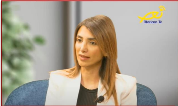
مريم TV - عالموعد 31 آذار 2023

في آذار/مارس 2023، استضافت محطتا تلفزيون لبنان وقناة مريم برنامج دعم المجتمع المحلي التابع للوكالة الأميركية للتنمية الدولية لمناقشة المساعدات المتنوعة التي يقدمها البرنامج على كافة الأراضي اللبنانية، من ضمنها مشاريع الدعم المجتمعي لتعزيز الوصول إلى الخدمات الأساسية، والمساعدة التقنية والتدريب الوظيفي، وإدارة مياه الصرف الصحي، وتطوير القوى العاملة.