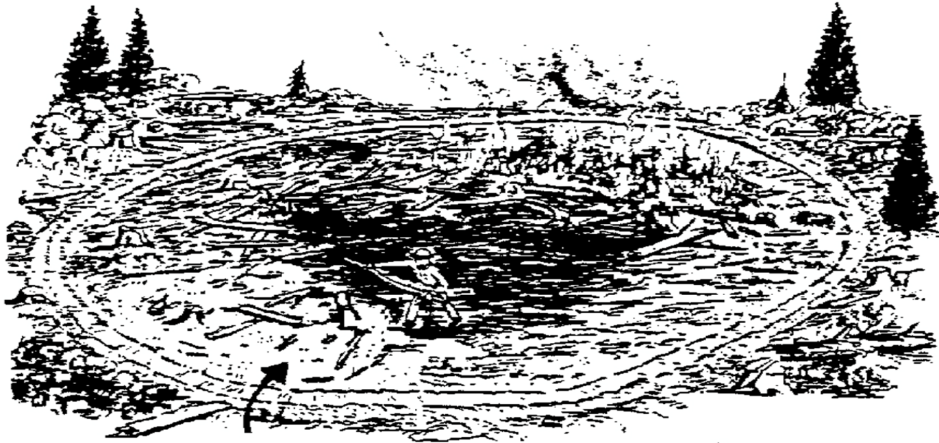
BONE YARD IN CLEARED AREA